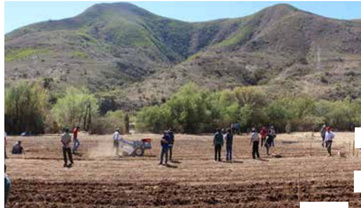
“Aprender Haciendo”, agricultores preparando la tierra para cultivar hortalizas (Camargo/Chuquisaca)