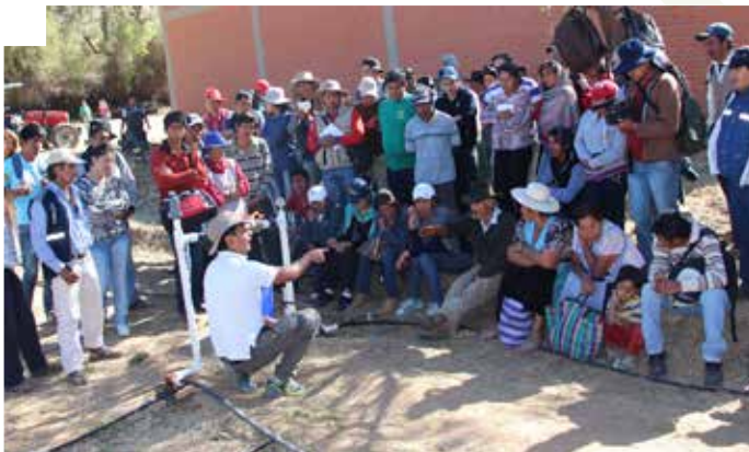
Capacitación en Sistemas de Riego Presurizado (Camargo/Chuquisaca)