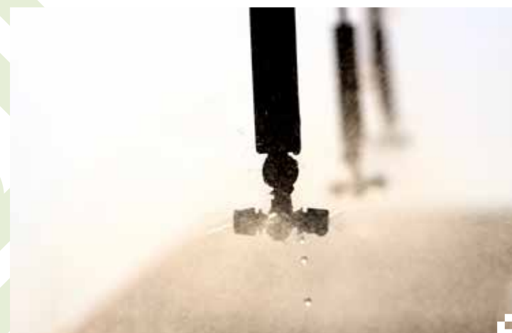
Sistemas de riego presurizado de bajo costo (Camargo/Chuquisaca)