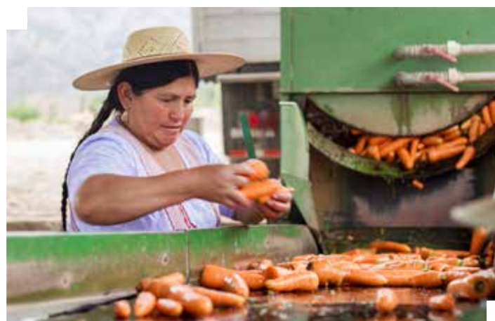
Lavado de zanahoria (Capinota/Cochabamba)

El proceso de Formación Continua tiene el objetivo de construir un sistema de formación y capacitación para el desarrollo agropecuario sustentable, que corresponda a las exigencias técnicas de los sectores relevantes agrícolas, agua y medio ambiente, a través del desarrollo de capacidades y cualidades del personal técnico del sector público y privado.