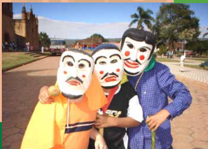
San José de Chiquitos