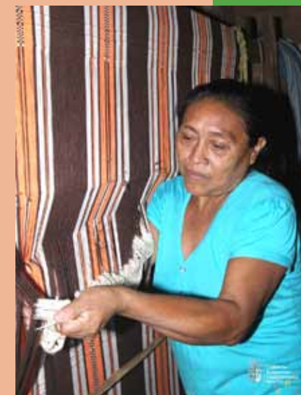
Ascención de Guarayos

De esta manera, Cambio Climático de la Secretaría de Desarrollo Sostenible y Medio Ambiente - SDSyMA, impulsa esta iniciativa a nivel departamental, nominada “DIÁLOGOS REGIONALES EN ADAPTACIÓN AL CAMBIO CLIMÁTICO” , con el objetivo de “Establecer Diálogos Regionales multi-actores en Adaptación al Cambio Climático en el Departamento de Santa Cruz”, esto con la finalidad que las regiones del Departamento de Santa Cruz cuenten con información oportuna en Adaptación al Cambio Climático, que coadyuve en la toma de decisiones para el sector público y privado.