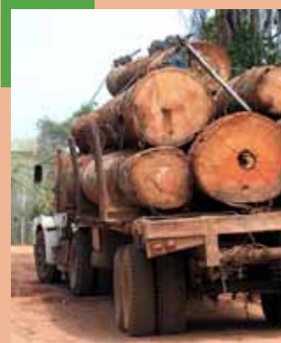
Camión con troncas en Ascención de Guarayos

Esta medida que coincide con una de las acciones definidas, también en la Política Pública Departamental de Mitigación y Adaptación al Cambio Climático, que tiene por objetivo “Elaborar un Plan de Acción para hacer frente a los efectos adversos del Cambio Climático y formular proyectos, con el fin de promover el aprovechamiento sostenible y la conservación de los bosques, la industria neutra en las emisiones de efecto invernadero, la disminución de la deforestación, y la prevención y control de las quemadas, cañaverales e incendios forestales”.