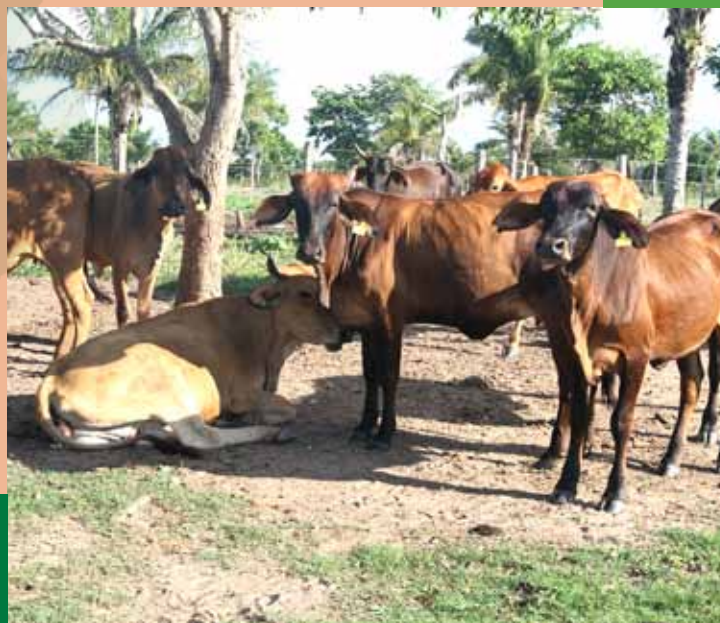
Ascención de Guarayos